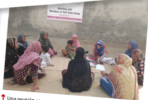
↑ Una reunión con un grupo de auto-ayuda, Distrito de Muzaffargarh, Pakistán.

Como parte del proyecto, la abogacía ha llevado a la presentación de una resolución en la Asamblea