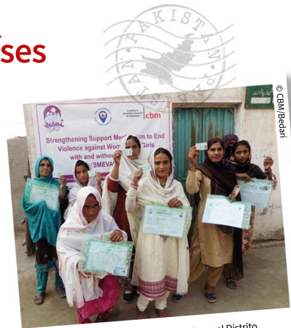
↑ Mujeres que participaron en el Proyecto en el Distrito de Muzaffargarh, Pakistán, muestran sus certificados de discapacidad y cédulas de identidad.

DIBC es el enfoque de CBM para llevar a cabo la Convención de las Naciones Unidas sobre los Derechos de las Personas con Discapacidad y asegurar que estas personas puedan disfrutar de sus derechos humanos y alcanzar su pleno potencial. Descubra cómo se lleva a cabo esto en cuatro países de diferentes regiones: Asia, las Américas, África Occidental y Central, así como África Oriental y Meridional.