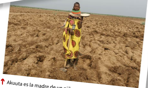
↑ Akuuta es la madre de un niño con discapacidad, afectada por la sequía en Turkana, Kenya.